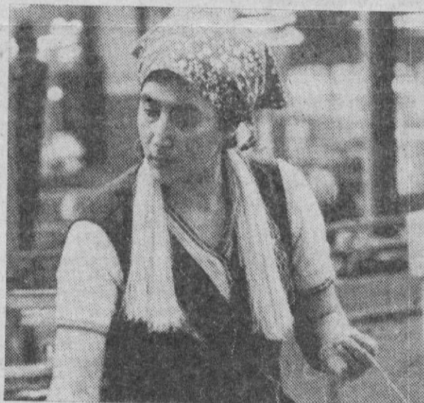
Распространение на Ве-ликолукском льноком-бинате получила ини-циатива коммунистов ткацкого производства, которые призвали тка-чей перейти на расши-ренную зону обслужи-вания станков, и сами в этом подали пример. Администрация и пар-тийная организация ком-

бината постоянно дер-жат под своим контро-лем вопросы повышения производительности тру-да, эффективности про-изводства, создают для этого необходимую ба-зу, стремятся исполь-зовать все имеющиеся ресурсы.