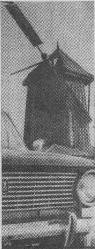
...Так и встретились две эпохи.