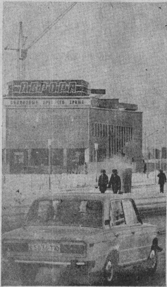
Сургут — город сибирский. Одна из самых молодых улиц.