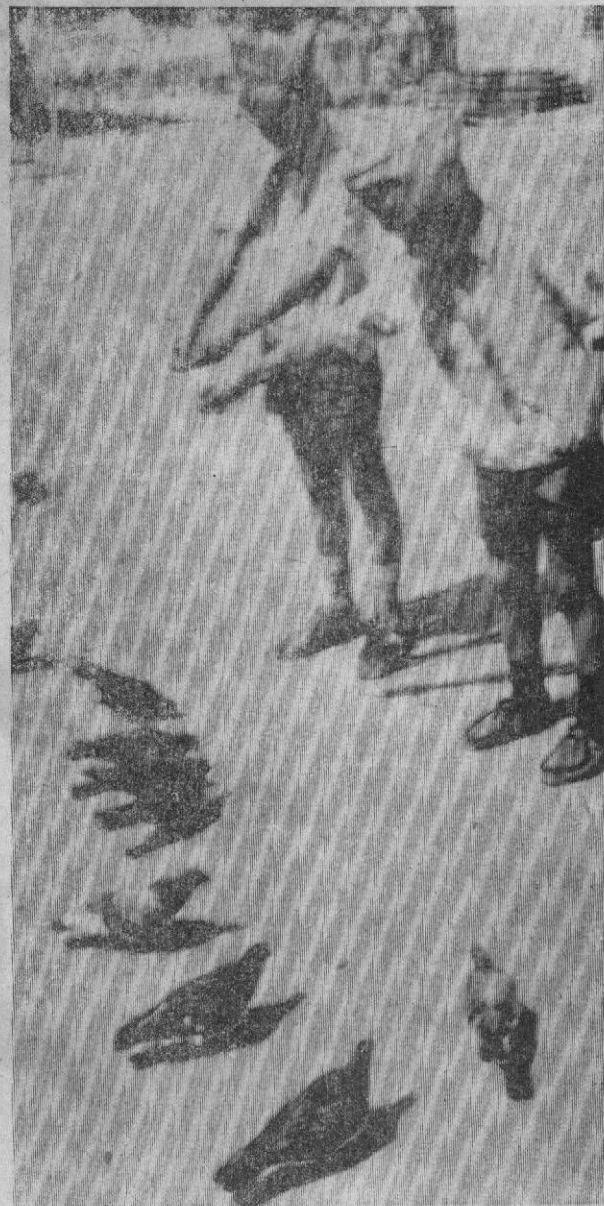
Голуби нашего детства Фотоэтиюд Е. Евгеньева.