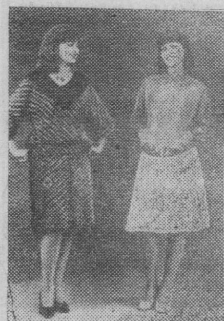
Добрые отношения сложились между коллективом Гродненской швейной фабрики, работника-