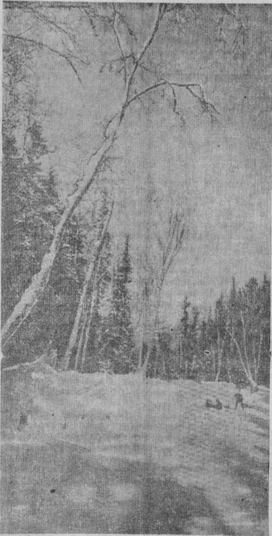
Зимний этюд.