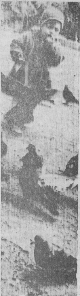
Когда на земле мир