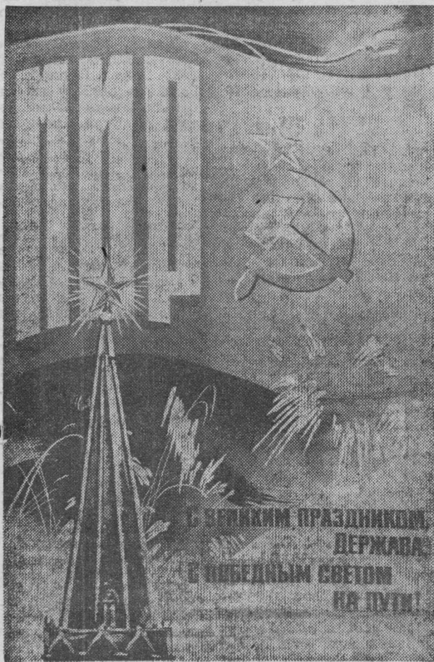
С ПЕРВЫМ ПРАЗДНИКОМ ДЕРЖАВА С ПОБЕДНЫМ СВЕТОМ НА ПУТИ!