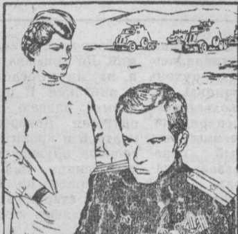
ЧЕРЕЗ ГОБИ И ХИНГАН

«Факт» — этот цветной художественный фильм литовских кинематографистов основан на подлинном событии времен Великой Отечественной войны. О зверской расправе фашистов над жителями маленькой литовской деревушки рассказывает он. Этот фильм — памятник жертвам фашизма снят режиссером-постановщиком Альмантисом Грикявичюсом. В нем заняты актеры Донатас Банюнис, Елена Соловей, Александр Кайдановский.