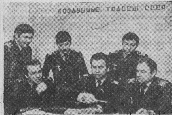
ВОЗРАШНЫЕ ТРАССЫ СССР