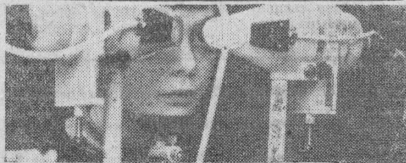
Белорусская ССР. Специалисты офтальмологического отделения 4-й детской клинической больницы Минска разработали систему тренировки зрения для детей, страдающих близорукостью.

На снимке: аппарат по тренировке зрения.