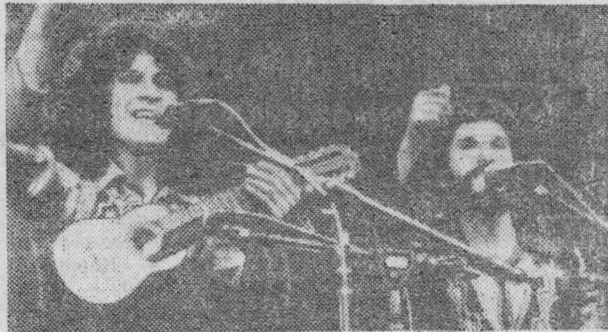
В Берлине состоялся традиционный фестиваль политической песни. В нем принимали участие исполнители из 35 стран мира, в том числе из Советского Союза.

Злую шутку, как ее ни хвалят, сыграла с нами специализация. Отделились транспортники, геофизики — удлинилась технологическая цепочка. А коли так, и рвется она легче.