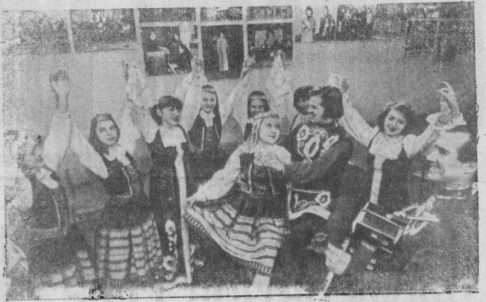
Большая дружба связывает трудящихся эстонского города Нарва с Ивангородом Ленинградской области. На снимке: участники художествен-

ной самодеятельности Нарвского и Ивангородского Домов культуры на совместной репетиции.