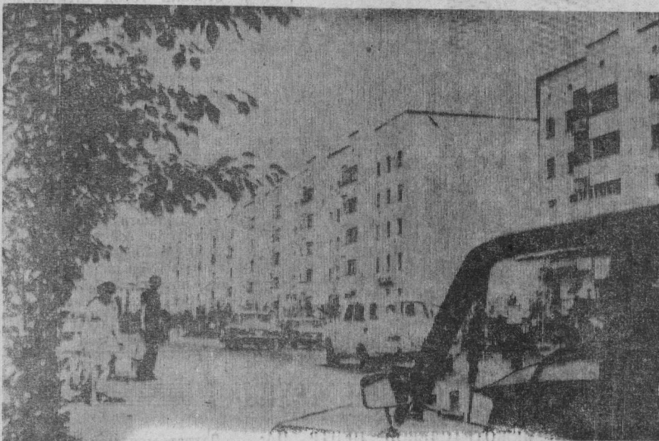
СУРГУТ. УЛИЦА ЭНТУЗИАСТОВ СЕГОДНЯ.