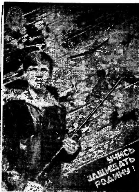
УНИВЕРСАЛЬНЫЕ ЗАЩИТАТОРЫ РОДНИ

Первый год одиннадцатой пятилетки — стартовый для нашего управления и очень удачный. Надеемся, что в последующие годы мы закрепим и приумножим достигнутое.