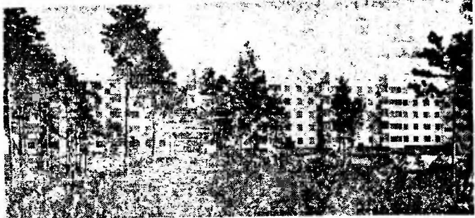
СУРГУТ. НОВАЯ УЛИЦА.

«Спортивно» нашими заместителями в прошлом году. С началом продаж очередной серии специализированных билетов. Напомним, что в последние дни продаж билетов от «Спортивно» — самая популярная спортивная лотерея. Ее привлекательная сила в том, что, приобретая билет, игрок тут же может узнать: выиграл он или нет, не надо ждать розыгрыша. Билет стоит пять рублей, один рубль. На него можно получить автомобиль марки «Волга» стоимостью 15.000 рублей или «Москвич», «Жигули» или «Саморожено». Денежные выигрыши в «Спортивно» — от 5 до 10.000 рублей. Остается пожелать неравнодушным настоящим и веры в то, что успех миглаион. Что вы можете сказать об этом? — Пока нечего. Этот вопрос решают сейчас в Москве. Однако могу сказать, что с этого года 20 процентов от продаж картонки будут отчисляться в бюджет родных той области, где организована игра. Очевидно, что современная игра пойдет в русле ее употребления, чтобы омикае про-