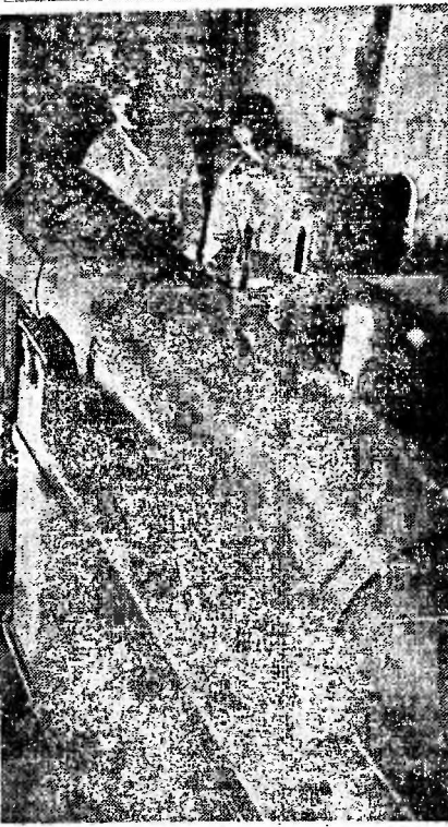
ТЮМЕНЬ. Центральной лабораторией Главлитгеологии несут большую работу по изучению и паспортизации образцов горных пород с различных нефтяных и газовых месторождений Западной Сибири.

На снимке: сотрудники лаборатории ведут спектральный анализ вмещающих пород.