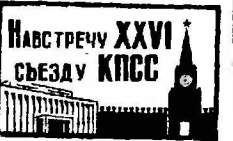
Навстречу XXVI съезду КПСС

Здесь начал действовать один из крупнейших в Средней Азии угольных разрез «Двондплате поле». Его мощность — около полу-миллиона тонн твердого топлива в год. (ТАСС)