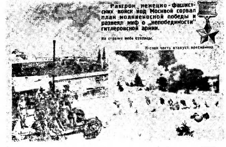
Разгром немецко-фашистских войск под Москвой стал одним из переломных моментов Великой Отечественной войны. Стремясь плав захвата Советской страны, гитлеровцы стремились в первую очередь поразить сердце нашего государства. Но неприступной стеной встали на подступах к столице воины Красной Армии. Проявляя массовый героизм, они реплили: ни шагу назад. Бессмертным исторни нашей страны останется