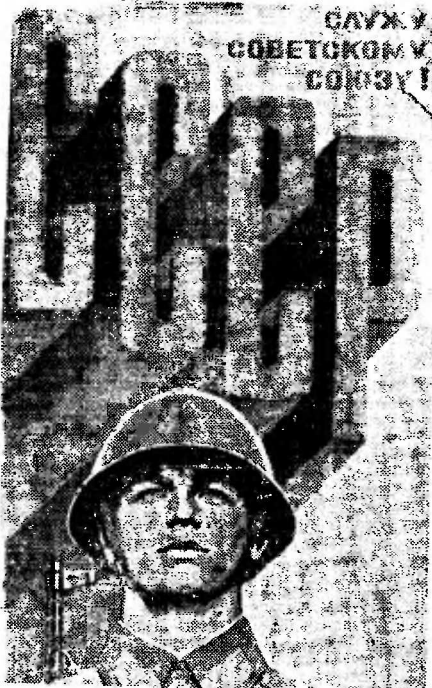
Плакат художника Ю. Копылова. Издательство «Плакат», Фотохроника ТАСС.

восходящих сил врага наши войскам было очень трудно, в передовые полки отощали Керчи. Часть бойцов укреплена в Багеронских каменоломнях.