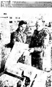
На Челябинском трубопрокатном заводе впервые в отрасли черной металлургии внедрены внутривальцовый автоматизированный учет электроэнергии.