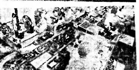
Широкой известностью у советских и зарубежных покупателей пользуется продукция Ленинского оптико-механического объединения имени В. И. Ленина.