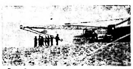
«Долгой смерти» раньше называли Нагархарскую долину, почти незанятую влагой. В летнее время здесь температура поднимается выше 50 градусов.

Пустынные земли оживила вода реки Кабул, которую переродили плотины. Образовавшиеся водохранилища позволило оросить десятки тысяч гектаров ранее засушливых земель.