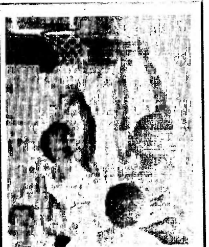
«ОСТРЫЙ МОМЕНТ»