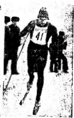
олимпийскую сборную команду СССР, олимпийский чемпион Исабрука в лыжной гонке Николай Бажуков.