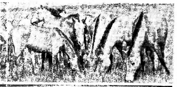
Редактор В. КИСЕЛЕВ

На снимке: лошади Поневальского. Десятки лет идет борьба за сохранение этих редких животных.