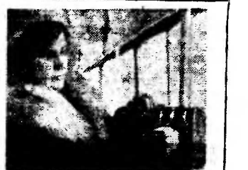
ВЕНГРИЯ. На городских автобусах в Эгере (область Хевеш) в этом году установлены автоматические билетные кассы советского производства.