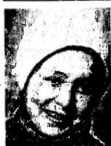
У НАШИХ СОСЕДЕЙ