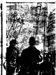
САРАТОВ. В объединении «Сибирь» реализуется крупная программа строительства агролесоводства на территории агролесоводства. В год оно даст тысячи тонн сырья, которое идет на изготовление искусственной шерсти.

В. ЛЕОНТЬЕВ, член строительного участка Сибиргормонтажа, электросварщик.