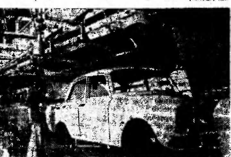
Наснижке: сборка легковых автомобилей «Москвич» на заводе «Балкан».

Большого успеха добился коллектив автомобильного завода при машиностроительном комбинате «Балкан» в болгарском городе Ловеч. С его сборочного конвейера вышел стотысячный автомобиль «Москвич». Это предприятие построено с братской помощью Советского Союза.