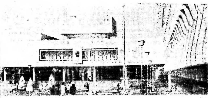
Город Ульяновск известен всему миру как родина Владимира Ильича Ленина, великого вождя трудящихся основателя Коммунистической партии и первого в мире Советского государства. Гордость и славу Ульяновска составляют памятные места, связанные с детскими и юношескими годами В. И. Ленина Ленинский Мемориал — главный памятник бессмертному

В. БЕРКУТ, инженер объединения ЗапСибурнефть