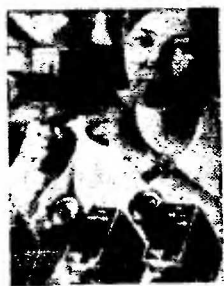
Московская область. Кинолюбительские кадры семейства «Раскогон» и «Кварц», выпускники Красногорского механического завода, слесари высокого качества, падежностью, долгие в чужбине. Продуцируют много охотно получают в десятках стран мира. В этом году завод начал выпуск новой модели любительского киносъемочного аппарата «Кварц 1х8С-2», которым можно снимать кинофильмы на цветных и черно-белых пленках формата «Супер». Новая камера имеет автоматическую установку экспозиции, что значительно упрощает процесс съемки. Кинокамера «Кварц 1х8С-2» удостоена государственного Знака качества.