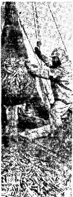
Востонская ССР. Хорош улов у рыбаков колхоза «Хиуу калура».