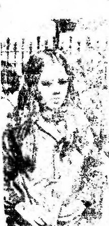
... стые рабочие, но и высококвалифицированные специалисты. Люди с высшим образованием.