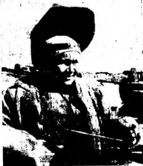
УДАРНЫЙ ФРОНТ — ЗАГОТОВКА КОРМОВ

Да, многое нам нужно сделать для того, чтобы организованно провести долгую сибирскую зиму. Подготовка к зиме должна проходить под неслучайным вниманием партийных организаций, депутатских групп, народных контролеров. Очень полезно создать на каждом крупном предприятии специальные штабы, которые бы контролировали выполнение намеченных мероприятий.