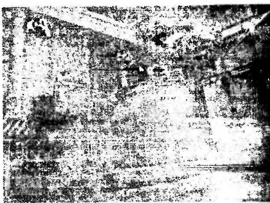
НОВОВОРОНЕЖСКАЯ АТОМНАЯ ЭЛЕКТРОСТАНЦИЯ.