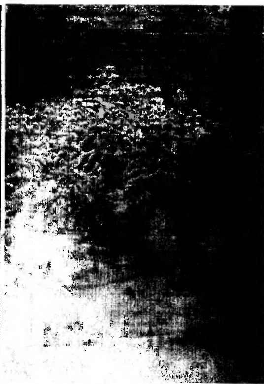
ЗДРАВСТВУЙ, ПЛЕМЯ МОЛОДОЕ, НЕЗНАКОМОЕ