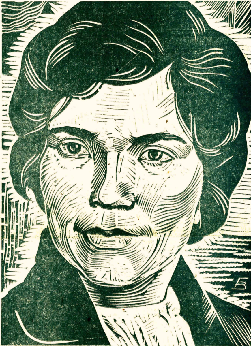
Современница. Линогравюра художника В. Горды.