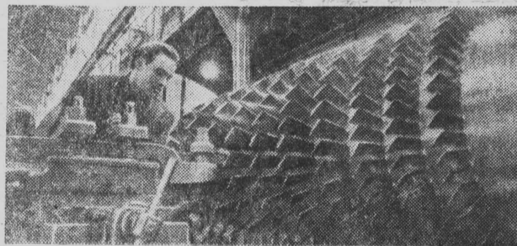
Ленинград. Машиностроители Невского завода имени В. И. Ленина перевыполнили годовую программу по всем технико-экономическим показателям.

Очень часто в ленинской комнате проходят занятия по лепке, аппликации. Дети знают, что Владимир Ильич любил природу.