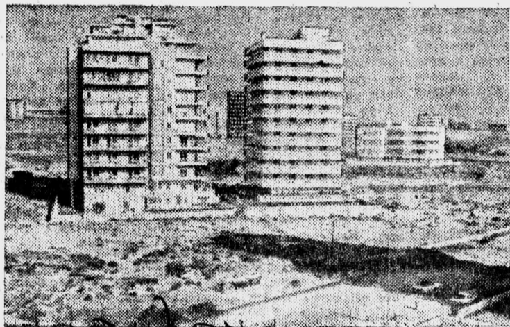
Ливан. Новостройки в Бейруте.