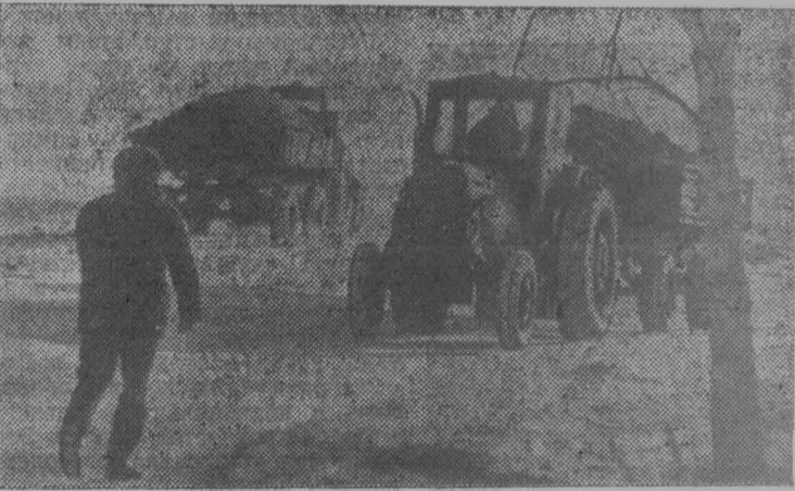
В Приангарье властвует зима. Укрытая снегом земля отдыхает, а колхозники полны заботами о будущем урожае.

В колхозе имени Чапаева Тулунского района Иркутской области тракторы с саморазгружающимися тележками уже доставили на поля более восьми тысяч тонн органических удобрений. Семена, которые весной лягут в землю, тщательно просушены, откалиброваны.