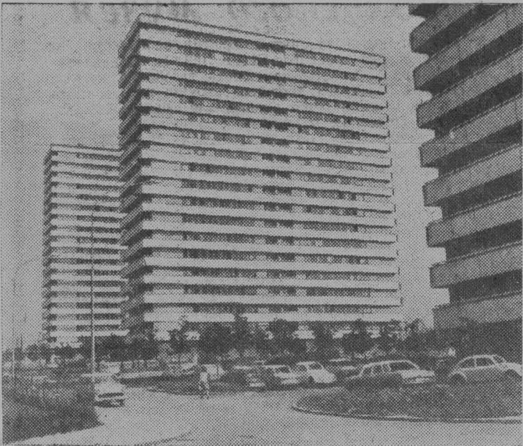
ЮГОСЛАВИЯ. За последние три десятилетия в Белграде построено 8 миллионов квадратных метров жилой площади. Это в полтора раза превышает весь предвоенный жилой фонд.