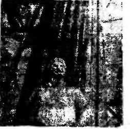
Вячеслав - Нобит - Дак. Этот район часто называют «сафитскими конюшнями» Туркмени.