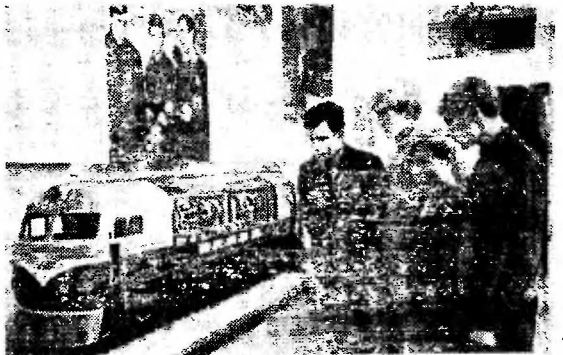
Открыта выставка научно-технического творчества молодежи. На ней демонстрируется около 10 тысяч экспонатов.