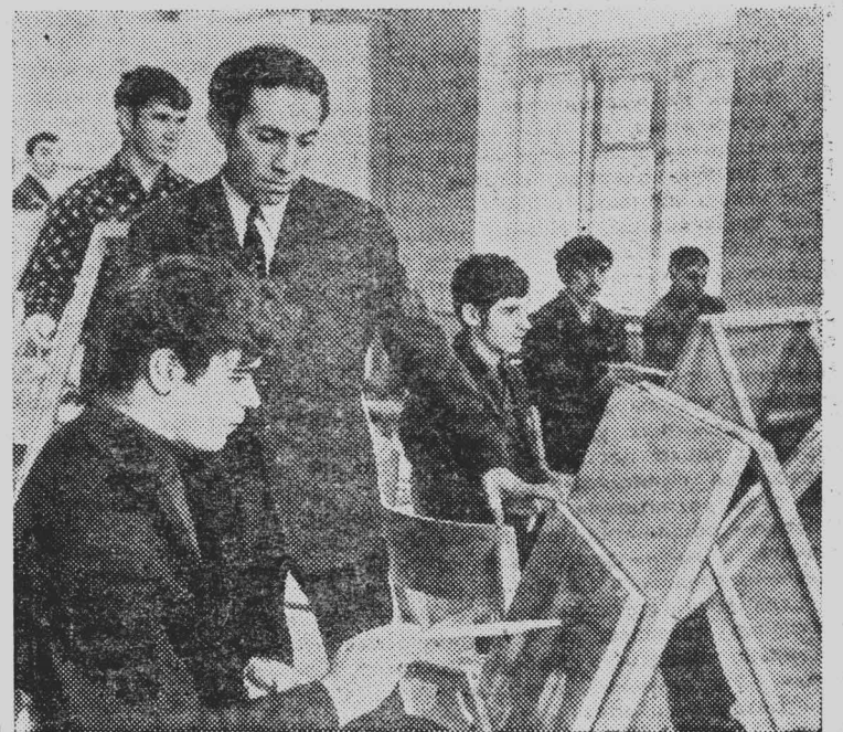
В педагогическом институте Махачкалы открыт новый факультет — художественно-графический. На первый курс принята талантливая молодежь, среди них народные умельцы из аулов Кубачи, Балхари, Унцукуля.