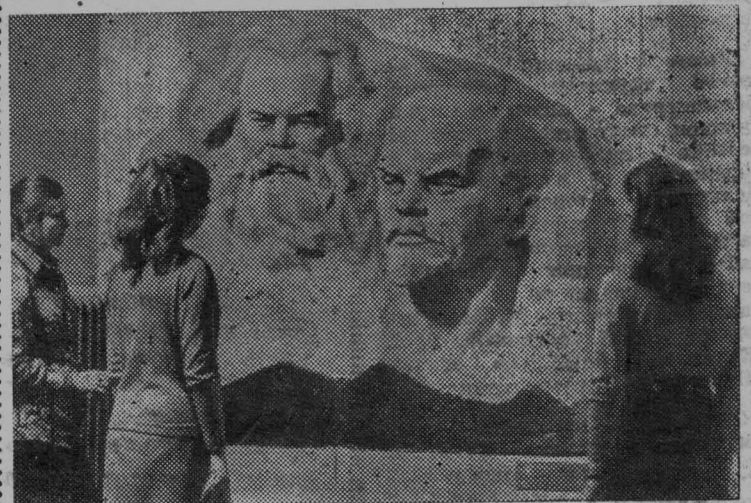
Исполнилось десять лет со дня открытия в Москве музея Карла Маркса и Фридриха Энгельса.

В экспозиции музея представлены рукописи, издания трудов К. Маркса и Ф. Энгельса, многочисленные материалы о их революционной деятельности и жизни, личные вещи и фотографии.