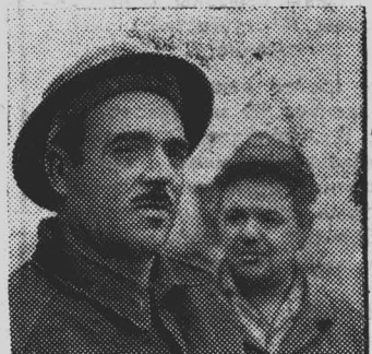
Вблизи районного центра Саатлы бригады Дуванинского управления разведочного бурения

Советский Азербайджан награжден двумя орденами Ленина (в 1935 и 1964 годах), орденом Октябрьской Революции (в 1970 году). Нефтяная промышленность республики награждена орденом Ленина в 1931 году.