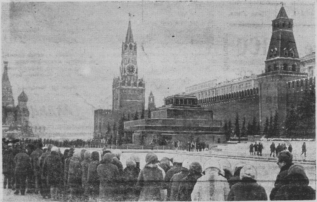
Москва. Красная площадь. Мавзолей В. И. Ленина.