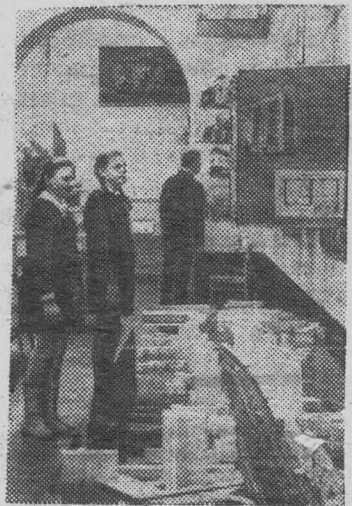
В СТРАНАХ КАПИТАЛА