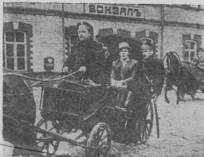
Киностудия «Молдова-фильм» выпустила новый художественный фильм «Взрыв замедленного действия» о создании в Кишиневе первой в России нелегальной марксистской типографии. Сценарий картины создан М. Мельником и В. Садковым при участии режиссера-постановщика В. Гажму.