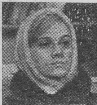
В павильоне Ялтинской киностудии идут съемки киноромана «Градостроители», автором и постановщиком которого

Черно-золотистая кристаллическая смесь, на которой буйно цветут розы, зеленеет распадающаяся озоновая оболочка. Кажется странным, что на этом грунте, напоминающем мелкие обломки целлулозы, может расти любящая культура. Эту необычную почву синтезировали белорусские химики. Сейчас соведущий Нижнетагильской лаборатории под руководством Е. И. Касыяненко строят технологию промышленного получения нового грунта.