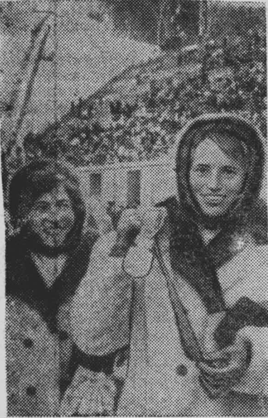
Вот и угас олимпийский огонь... Подведены итоги XI зимних Олимпийских игр, проходивших в течение десяти дней в японском городе Саппоро и его окрестностях.

Заключительным аккордом выступлений советских спортсменов на белой Олимпиаде явилась победа наших хок-