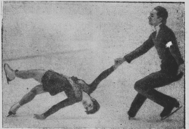
Редактор А. ЗУБАРЕВ.