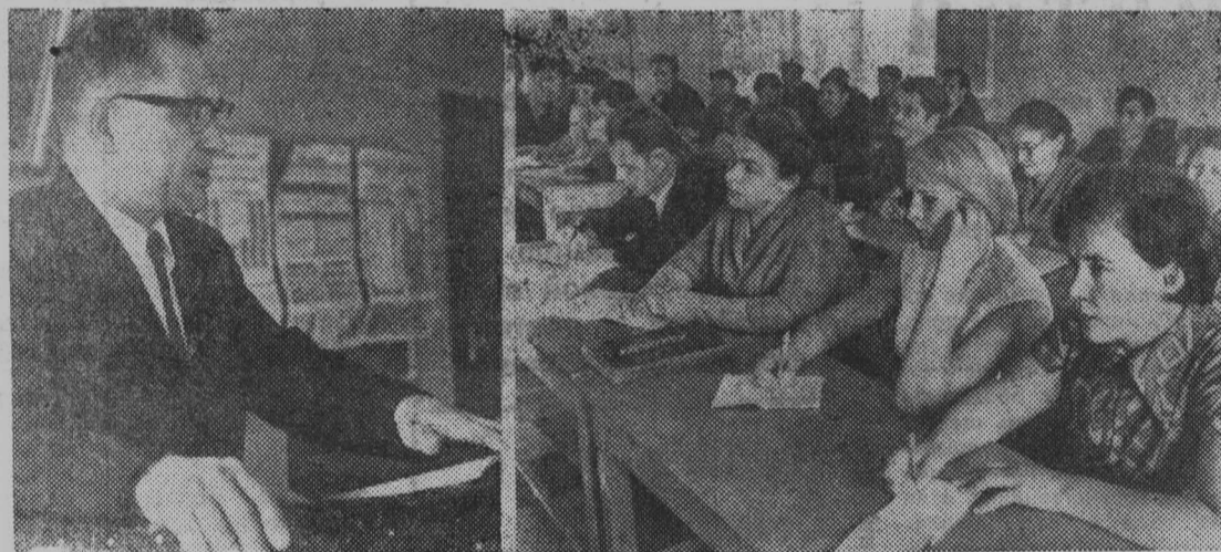
Дагестанская АССР. Организовано началась учеба в системе политического просвещения на Махачкалинском заводе текстильного стекловолокна. Кроме различных кружков и семинаров, здесь работает филиал вечернего университета марксизма-ленинизма. На первом занятии выступил доктор экономических наук старший научный сотрудник института экономики мировой социалистической системы Академии наук СССР К. Попов. На снимке: К. Попов выступает перед слушателями вечернего университета на заводе.