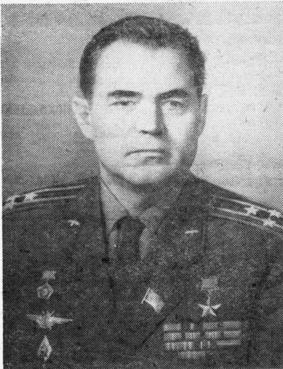
Командир космического корабля «Союз-9» Андрей Григорьевич Николаев.