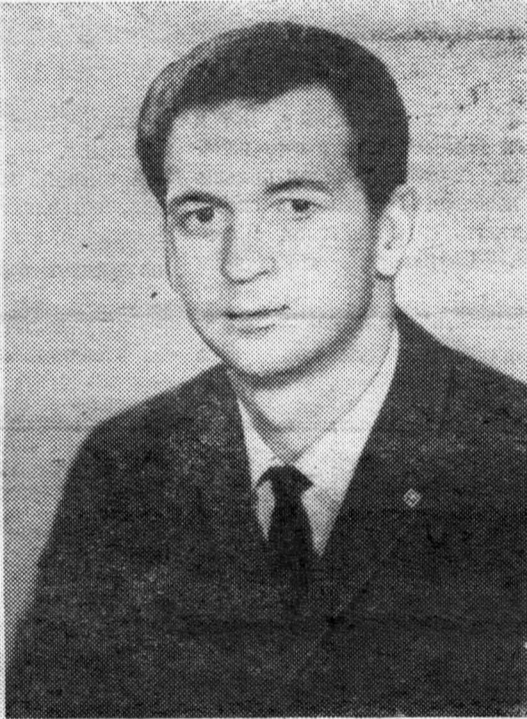
Бортинженер космического корабля «Союз-9» Виталий Иванович Севастьянов.