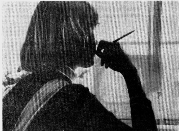
«ЕВГЕНИЙ ОНЕГИН», «ГЕРОИ НАШЕГО ВРЕМЕНИ», «МЕРТВЫЕ ДУШИ»... ШЕДЕВРЫ РУССКОЙ И МИРОВОЙ КЛАССИКИ, НАПИСАННЫЕ НЕ ШАРИКОВОЙ РУЧКОЙ, КТО ЗНАЕТ, ВОЗМОЖНО ИЗ ПОД ЭТОГО ПЕРА ТОЖЕ КОГДА-НИБУДЬ ВЫЛЮТ-СЯ БЕССМЕРТНЫЕ СЛОВА.