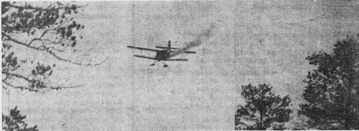
Только самолетом можно долететь.

— Мне очень жаль, Вальтер... Я, кажется, причинила вам много хлопот.