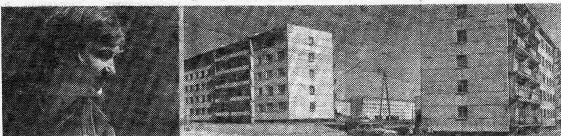
В 60 километрах от села Шушенского развернулась грандиозная стройка

Есть комнаты-бытовки, где можно отдохнуть, почитать газеты, погушать.