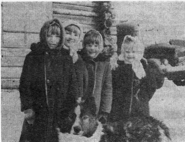
«Четверо и собака».

Что такое? Целой стаей Мухи белые летают, И роятся, и кружат, Только тихо, не жужжат.